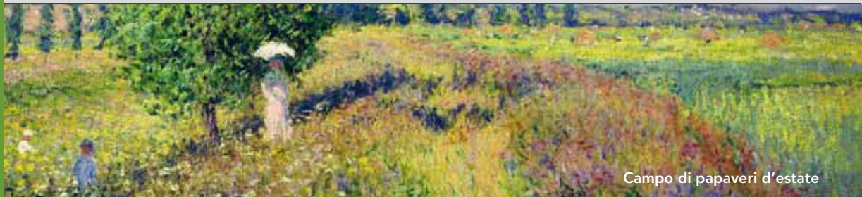
Campo di papaveri d'estate